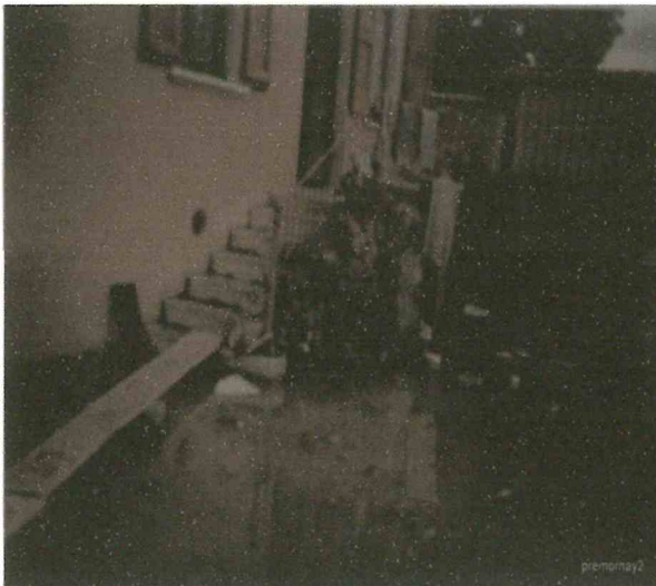
Inondation au croisement des chemins des abattoirs et des sausays