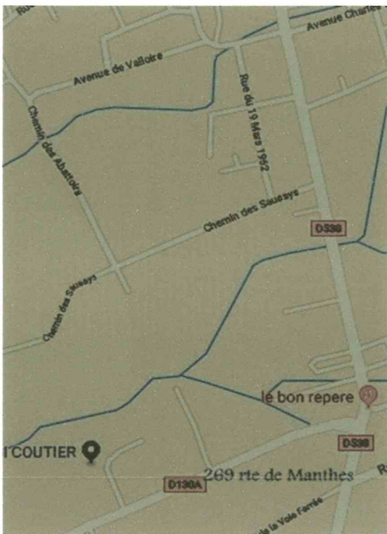
Situation 269 rte de manthes